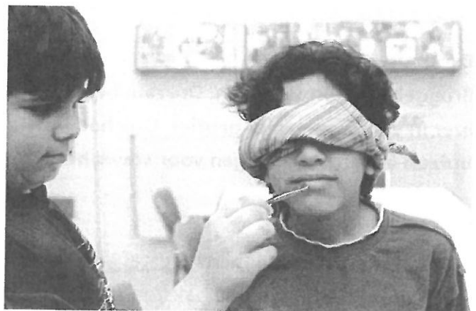
Als je niets ziet, voel je anders.