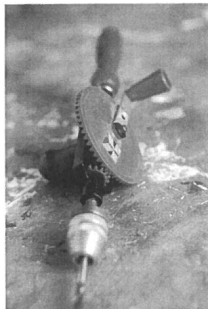
Kracht kan de hoek om gaan.