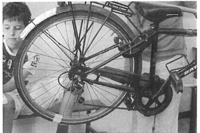
Met versnellingen fiets je makkelijk tegen de wind in.