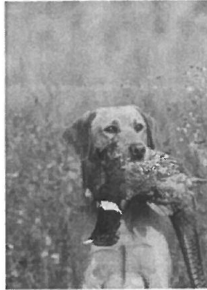
Een hond heeft een goede neus. Daarmee ruikt hij zijn prooi.

groeit hier de nieuwe plant uit. Sommige planten gaan dood. Maar uit hun zaden groeien nieuwe plantjes.