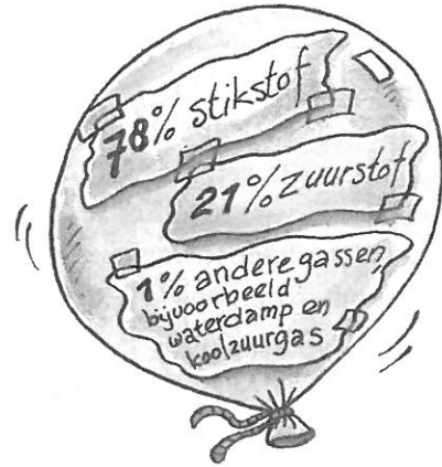
Lucht bestaat uit gassen. Zuurstof en stikstof zijn belangrijk voor het ademen.

Als de temperatuur buiten laag is, zetten we de verwarming aan. Je zet de thermostaat in de kamer dan wat hoger. Met de thermostaat kun je de temperatuur in de kamer regelen. Op de thermometer kun je zien hoe warm het is. Een installateur legt de verwarming aan. Ook vervangt hij de verwarmingsketel als deze stuk gaat.