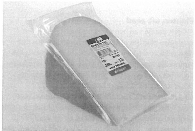
Bij vacuüm verpakte kaas kan geen lucht komen.