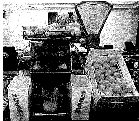
Input, proces en output. Allemaal in één machine.

Sensoren zijn meetapparaatjes. Zij zorgen voor de input van het apparaat. Er zijn verschillende soorten sensoren, zoals lichtsensoren en geluidssensoren. Nadat een sensor iets heeft waargenomen, volgt er actie. Er gaat bijvoorbeeld een lampje branden of er gaat een motortje aan. Die lampjes en motortjes noemen we actuatoren . Ze zorgen voor de output. Veel ingewikkelde apparaten hebben ook een microprocessor , een piepkleine computer. Die computer neemt de besluiten.