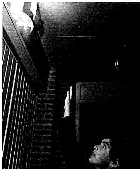
Hoe weet de lamp dat hij aan moet gaan?