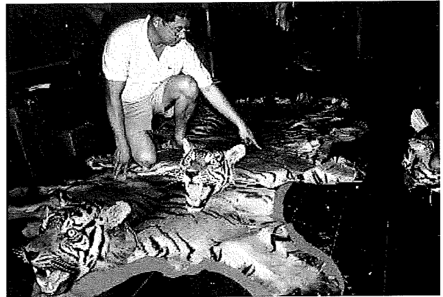
Mensen zorgen er ook voor dat dieren uitsterven.

Planten gebruiken koolzuurgas bij de fotosynthese . Door fossiele brandstoffen te verbranden, zorgt de mens voor te veel koolzuurgas. Te veel koolzuurgas in de dampkring zorgt voor het broeikaseffect . Daardoor wordt het warmer en kan de zeespiegel stijgen . Dat zorgt voor overstromingen. Door groene energie te gebruiken, kunnen we de klimaatverandering stoppen.