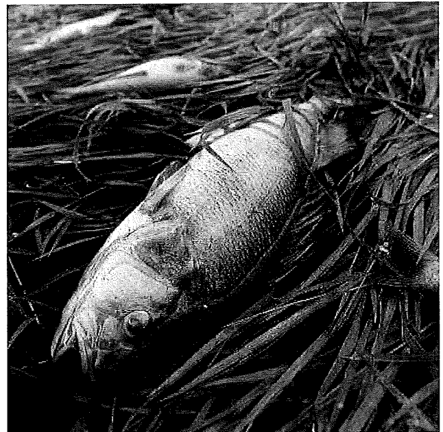
Als de vissen dood zijn, heeft de otter niets te eten.