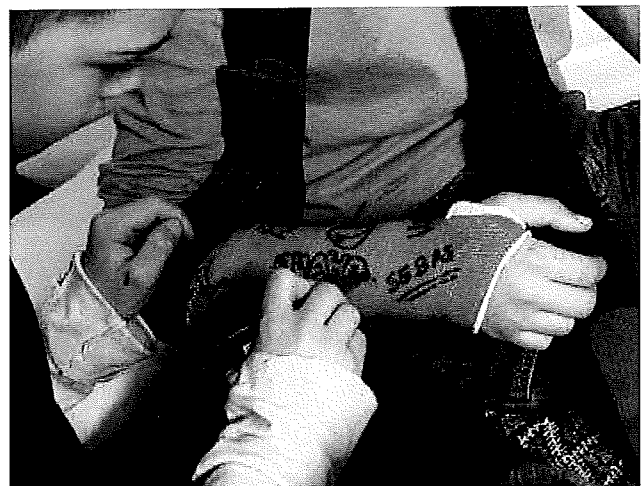
Gipsverband zorgt ervoor dat je bottdelen niet bewegen.